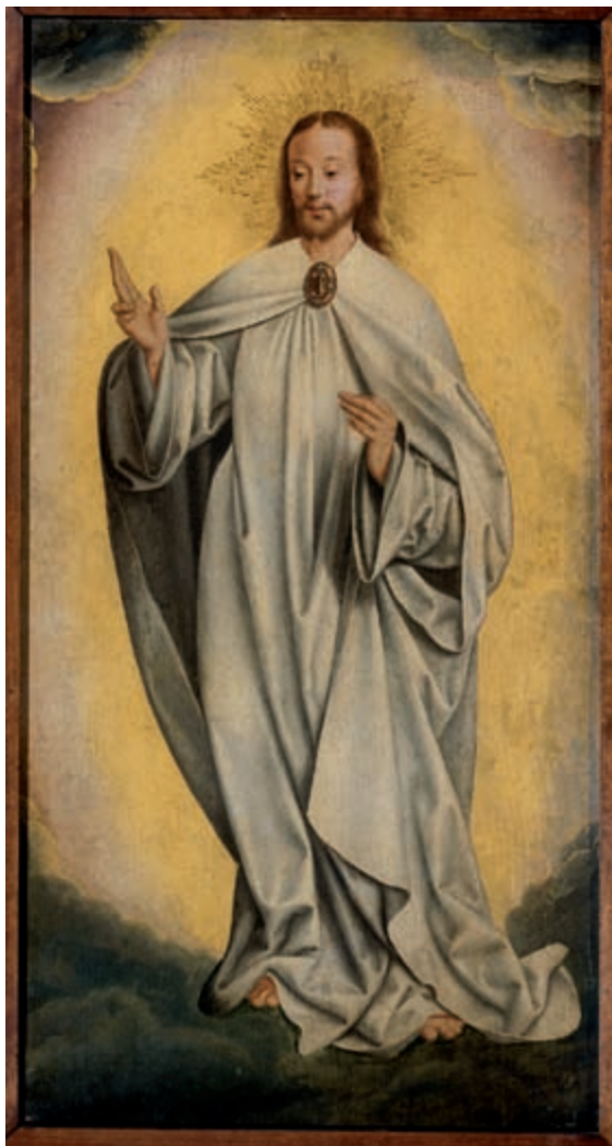
De verrijzenis van Christus door Jan Joest van Calcar collectie Rijksmuseum Amsterdam

Paaseucharistie Om 10.45u in O.L.V. van Troost: Gezinspaasviering met doop van 6 kinderen.